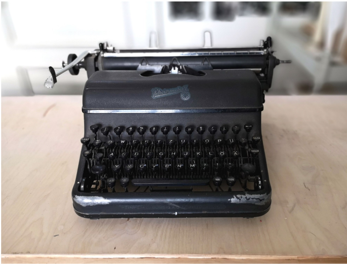
Schreibmaschine Rheinmetall GS (hergestellt 1949 in Sömmerda von der Rheinmetall Borsig AG)